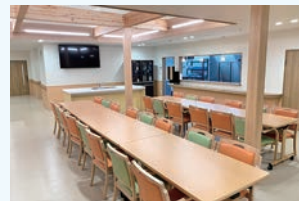
オープンキッチン